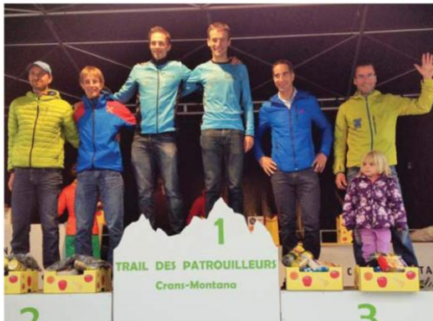
Le podium du grand parcours «Truberlstock».