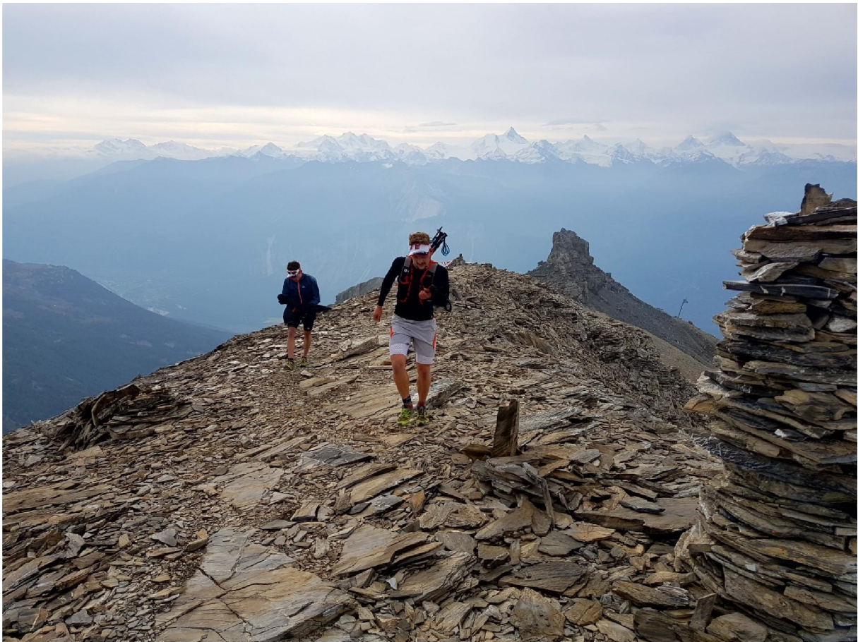
Trail des Patrouilleurs / Rue Beau-Soleil 8 / 3963 Crans-Montana www.traildespatrouilleurs.ch