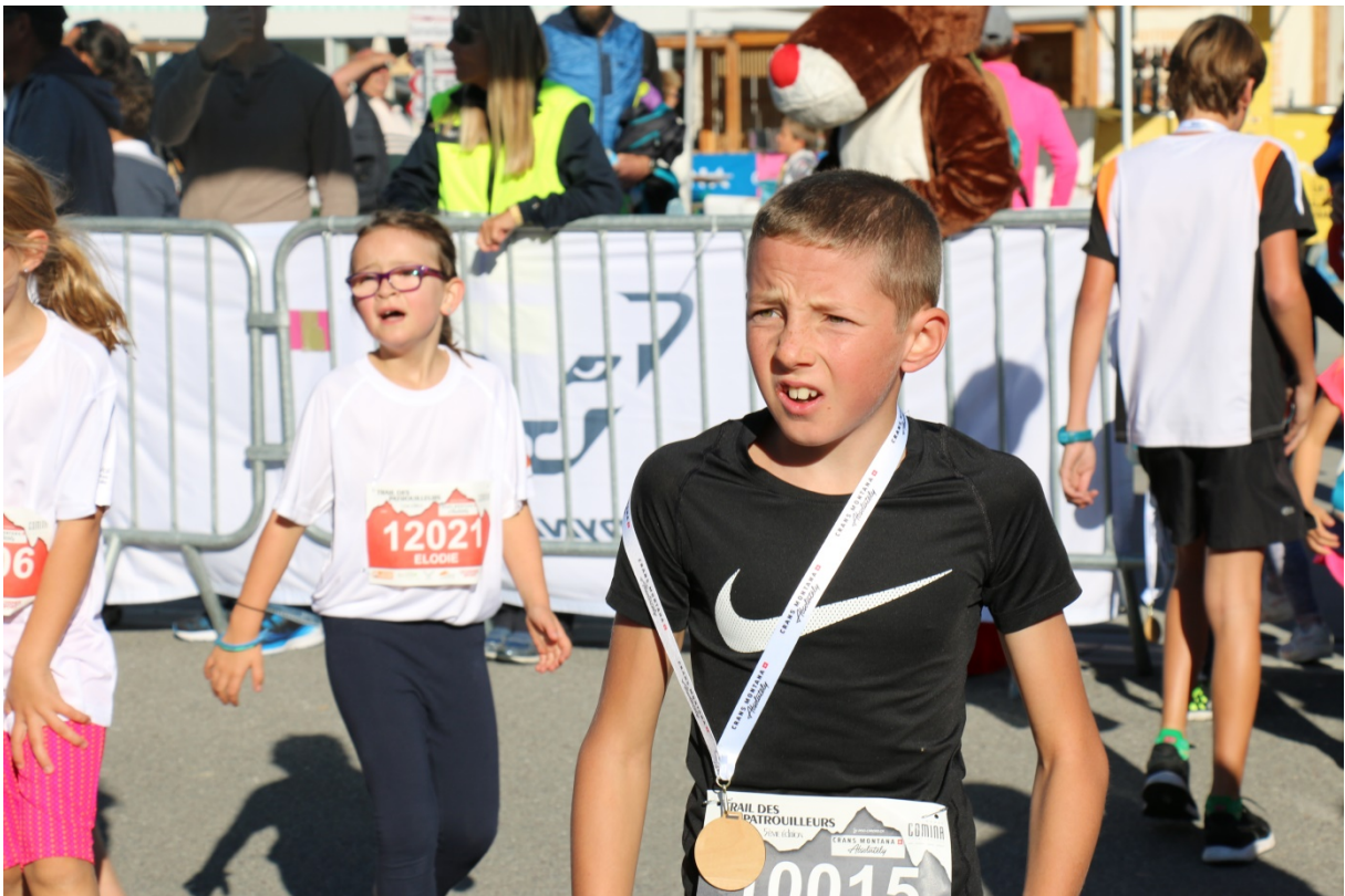
Trail des Patrouilleurs / Rue Beau-Soleil 8 / 3963 Crans-Montana www.traildespatrouilleurs.ch