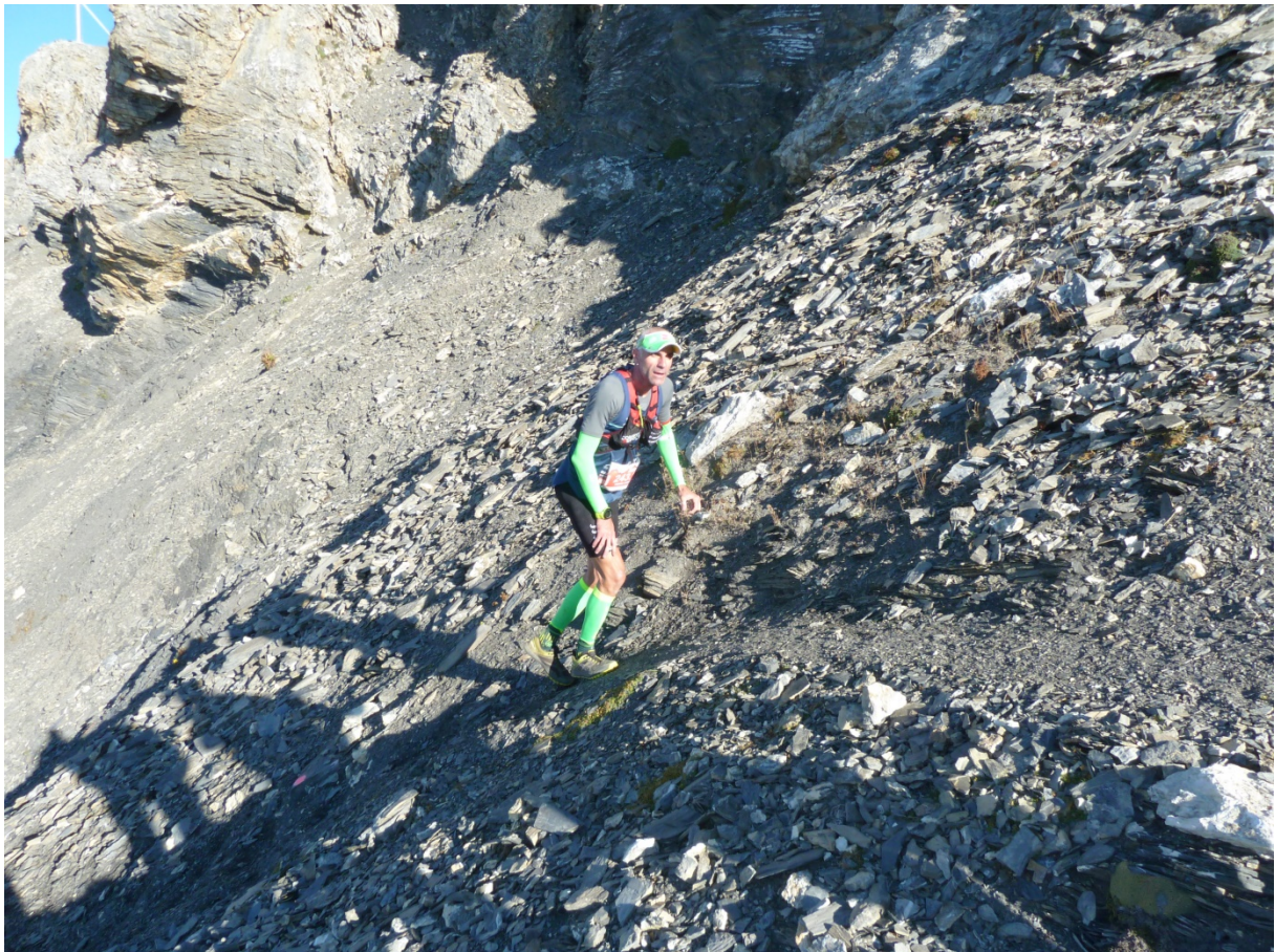
Trail des Patrouilleurs / Rue Beau-Soleil 8 / 3963 Crans-Montana www.traildespatrouilleurs.ch