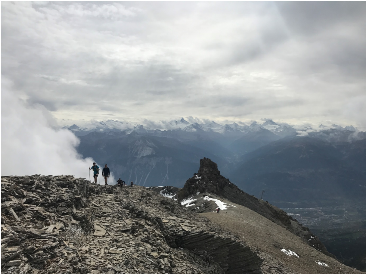
Trail des Patrouilleurs / Rue Beau-Soleil 8 / 3963 Crans-Montana www.traildespatrouilleurs.ch