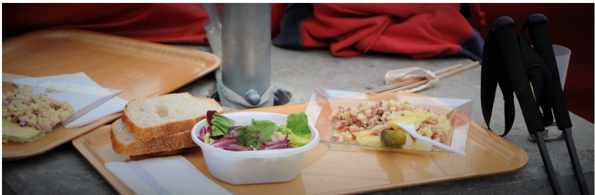
Trail des Patrouilleurs / Rue Beau-Soleil 8 / 3963 Crans-Montana www.traildespatrouilleurs.ch