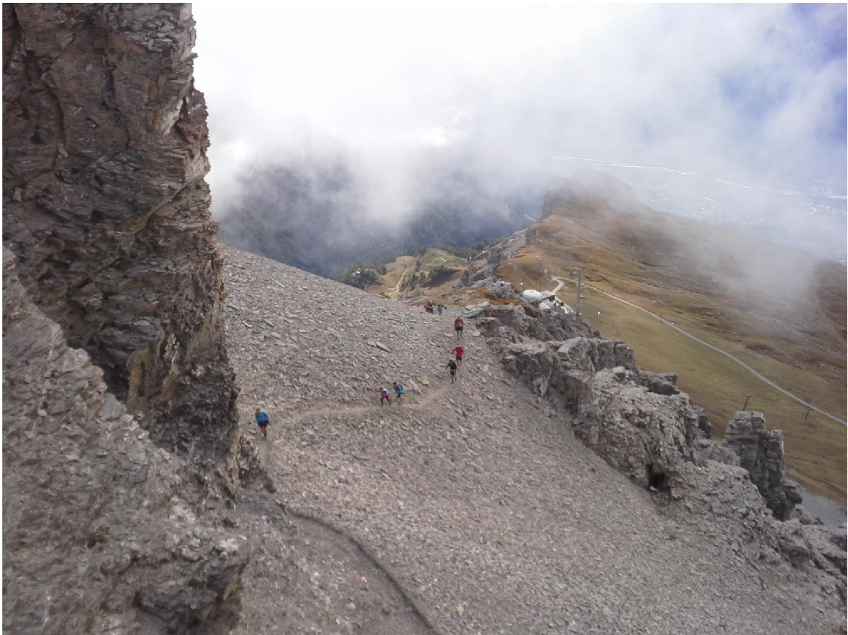
Trail des Patrouilleurs / Rue Beau-Soleil 8 / 3963 Crans-Montana www.traildespatrouilleurs.ch