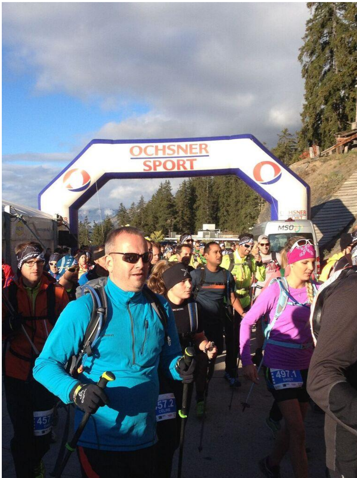
Trail des Patrouilleurs / Rue Beau-Soleil 8 / 3963 Crans-Montana www.traildespatrouilleurs.ch