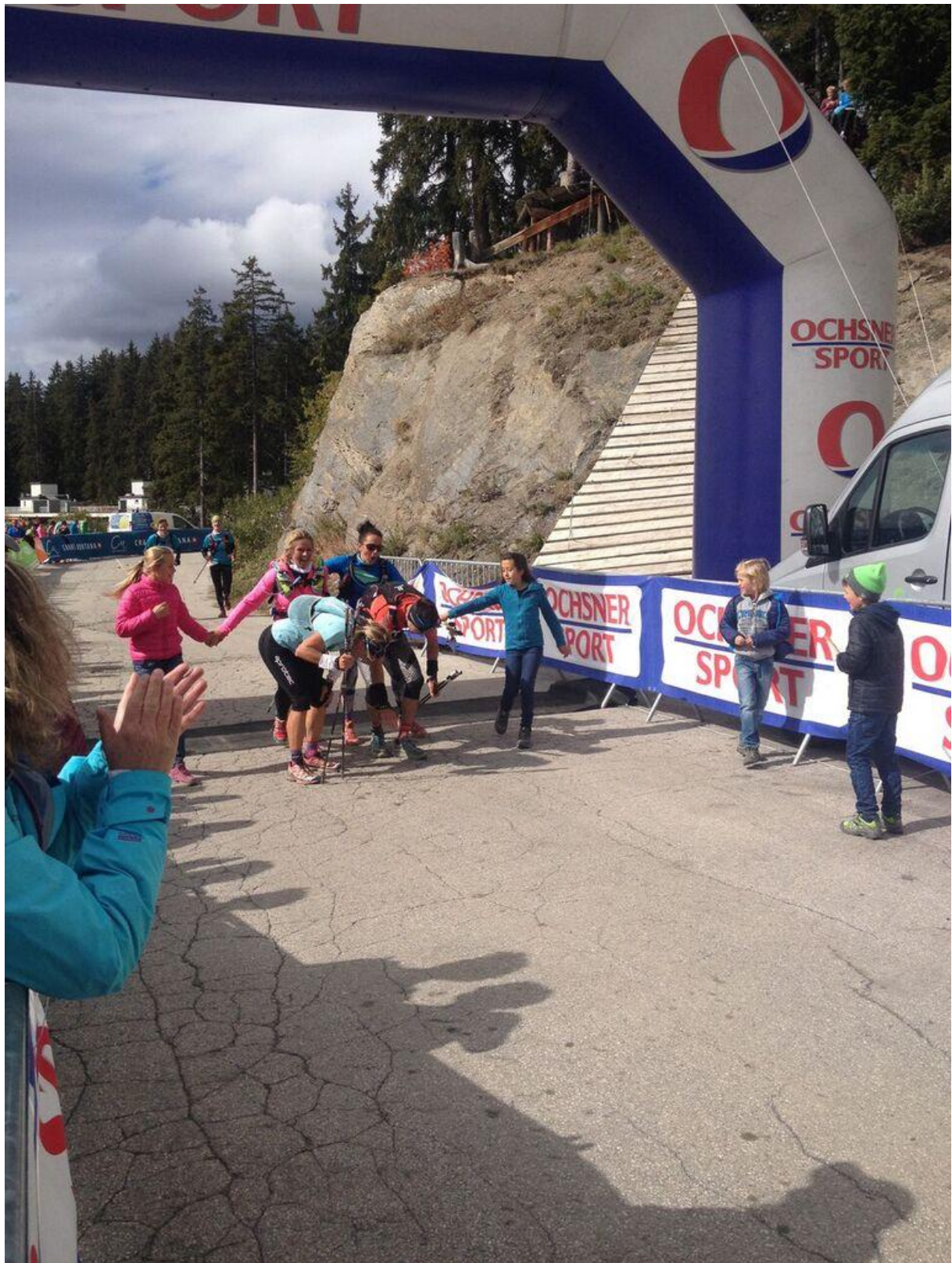
Trail des Patrouilleurs / Rue Beau-Soleil 8 / 3963 Crans-Montana www.traildespatrouilleurs.ch